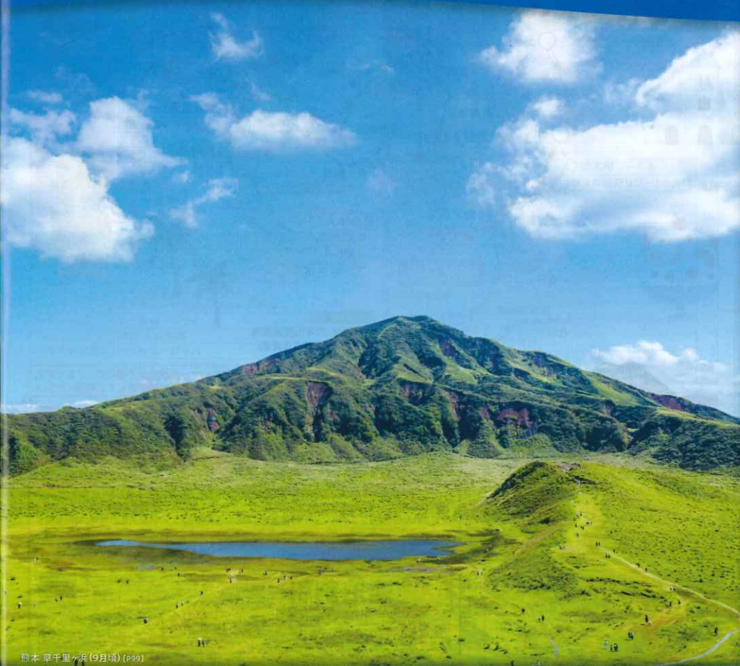
熊本 葦千里ヶ原 (9月頃) [P99]

※一部のホテル・旅館の紹介となります。 ※詳しくは3ページの二次元コードよりご覧ください。