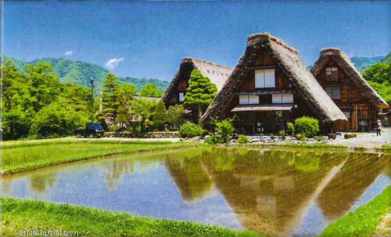
白川郷 (6月頃) (P99)