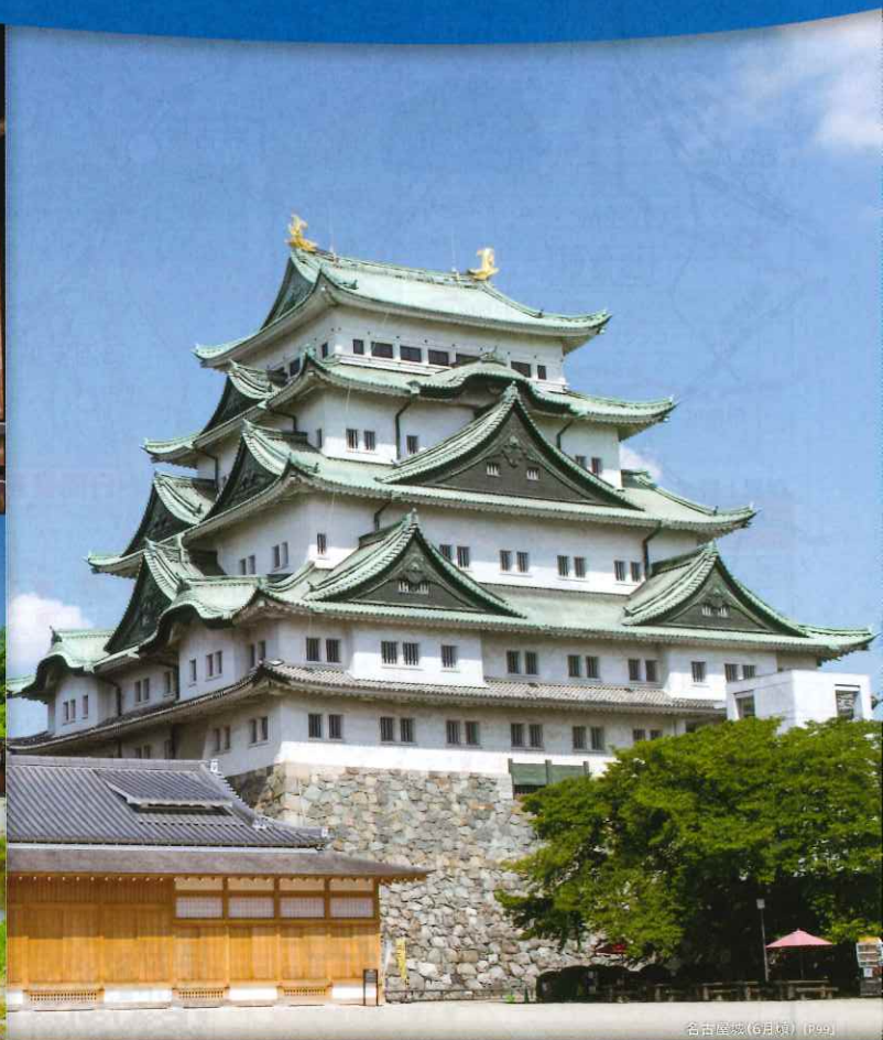
名古屋城 (6月頃) (P99)

宿泊・JRセットプランは出発当日まで、 近鉄セットプランは前日までにお申込みください。 (一部除く) ※お申込み可能日は店舗により異なります。