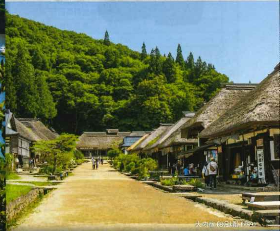
大内宿 (8月頃) [P99]

出発当日までお申込みいただけます。 (一部除く) ※お申込み可能日は店舗により異なります。