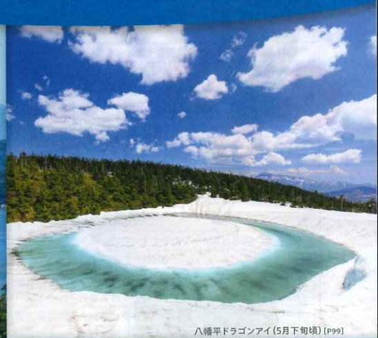
八幡平ドラゴンアイ (5月下旬頃) [P99]