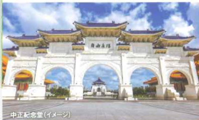
中正紀念堂(イメージ)

TOUR POINT 3 追加代金で 台北 九份 十分 などを満喫 参加可能! 日本申込/日本払い 観光券もご用意!!