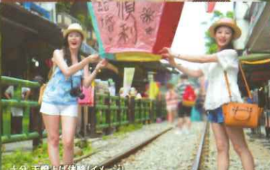
十分 天燈上げ体験(イメージ)