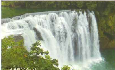
十分瀑布(イメージ)